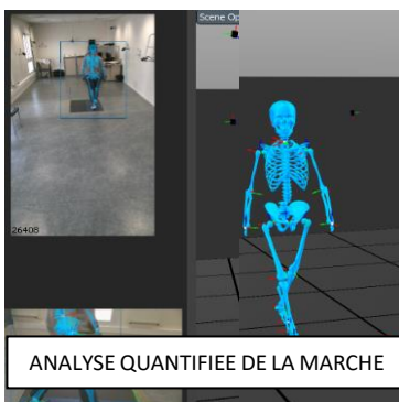
ANALYSE QUANTIFIEE DE LA MARCHÉ